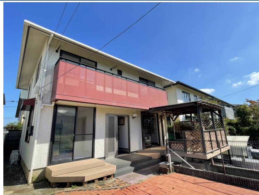
障がい者グループホーム ポノ白旗 (神奈川県藤沢市)

----- 本社 〒165-0021 東京都中野区丸山2-5-20 パラスト野方103